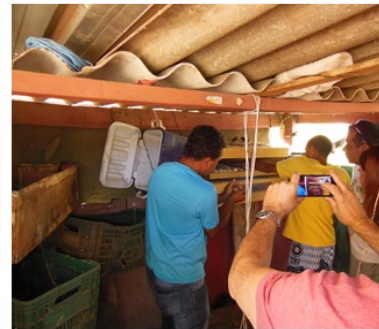
PDCI - Brasília - DF