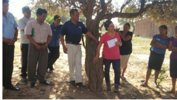
Guarani, (Isoso, Bolivia)