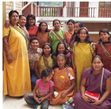
Guaranis - Misiones, Argentina