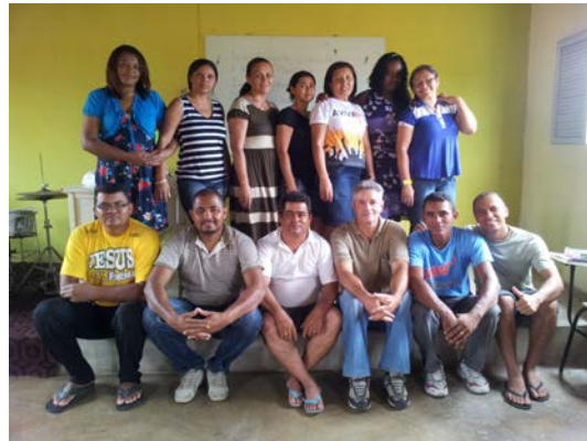
CDC 1 - Piancó - Paraíba