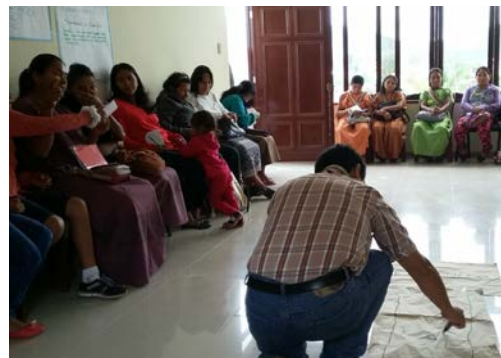
Treinamento dos Yanesha, Peru