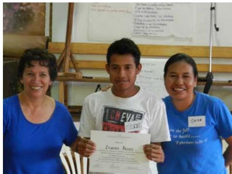
CDC 1 Oral, Guaranis - Misiones, Argentina