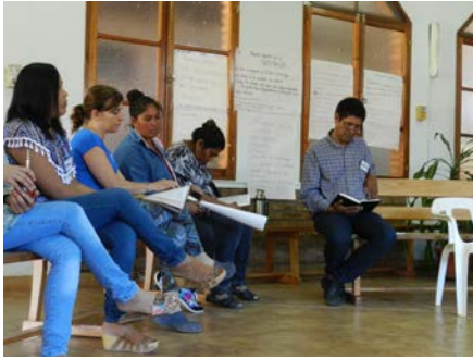
Oom (Formosa, Argentina)